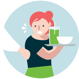
လိင်ပိုင်းဆိုင်ရာ နှောင့်ယှက်ခြင်း