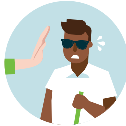
ခွဲခြားဆက်ဆံခြင်း