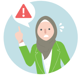
အလုပ်ခွင် အခွင့်အရေး များနှင့် ပတ်သက်၍ အငြင်းပွားမှုများ