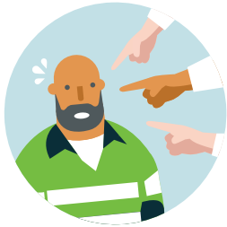
အနိုင်ကျင့်ခြင်း